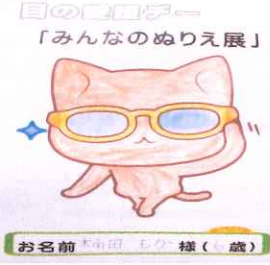
目の健康フェア「みんなのめりえ展」

保育園児たちの色彩感覚の豊かさです。これは日頃の色彩溢れる生活の中から生まれたり、性格なども影響していると思っ