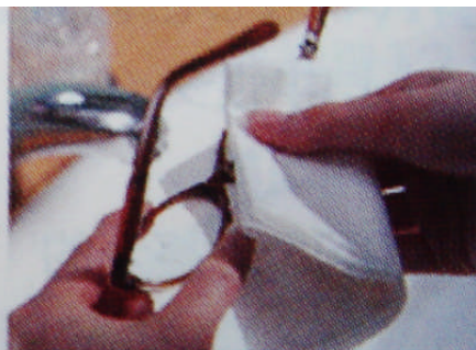
驚くほどスッキリクリアな仕上がりです。