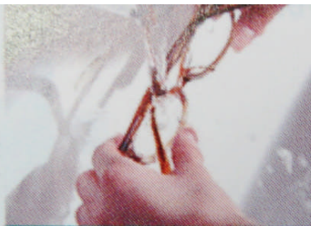
こすらず、そのまま水で洗い流すだけでOK!