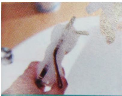
メガネのシャンプーをシュッシュとスプレー

汚れたメガネにシュッシュとスプレーし、後は水で流し、拭くだけでプレームもレンズもピカピカ!いまままでのしつこい汚れも、皮脂や整髪料などのスツキリ洗淨でき、スピーディー&クリアな仕上げです。